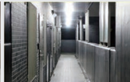
立ち会い(業者対応)